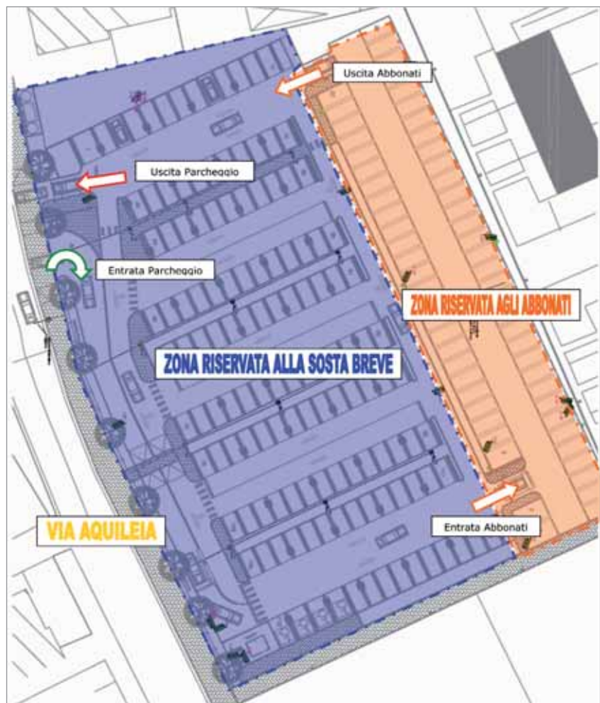
La planimetria del parcheggio Volta