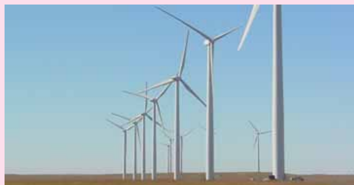
Un esempio di impianto eolico. Il vento è la prima tra tutte le energie rinnovabili.

La bioedilizia è l'insieme di accorgimenti che conducono a realizzare costruzioni a basso impatto ambientale. I criteri di progettazione degli edifici bio-edili o sostenibili ambientalmente, riguardano sia la riduzione dei consumi energetici che il risparmio delle altre materie prime, quale, ad esempio, l'acqua. Gli edifici di edilizia sostenibile, sono quindi costruzioni attente sia al consumo di risorse, sia ai carichi ambientali (riduzione delle emissioni di CO2 derivanti dall'insediamento). Nella progettazione di tali edifici, viene prestata attenzione particolare alla manutenibilità dell'edificio (al fine di ridurre, nel tempo, i costi derivanti dalla gestione del fabbricato). Viene inoltre prestata attenzione alla qualità degli interni, al fine di realizzare un fabbricato più confortevole per i suoi residenti.